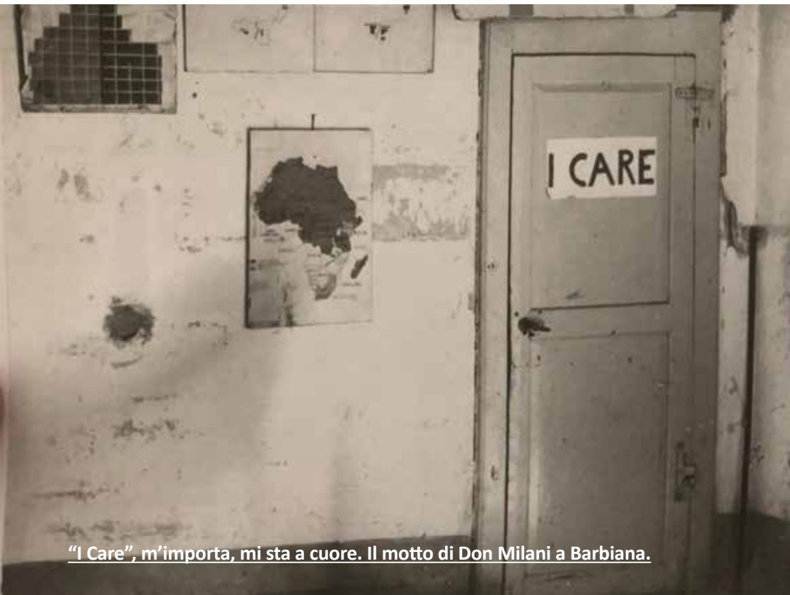
“I Care”, m’importa, mi sta a cuore. Il motto di Don Milani a Barbiana.